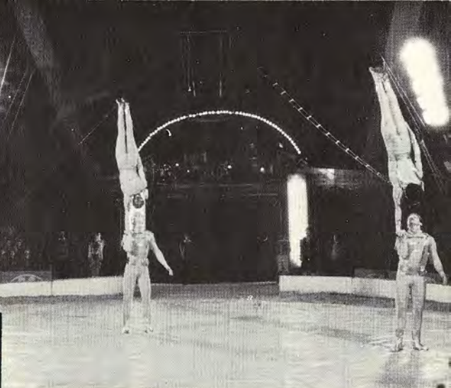
Bild 7. Ihre erste Zirkussaison erleben die Absolventen der Staatlichen Fachschule für Artistik: Die Cadetts