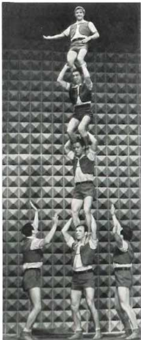
Die Tornados zeigen unter anderem ihren Spitzentrick „Vier Mann hoch“.