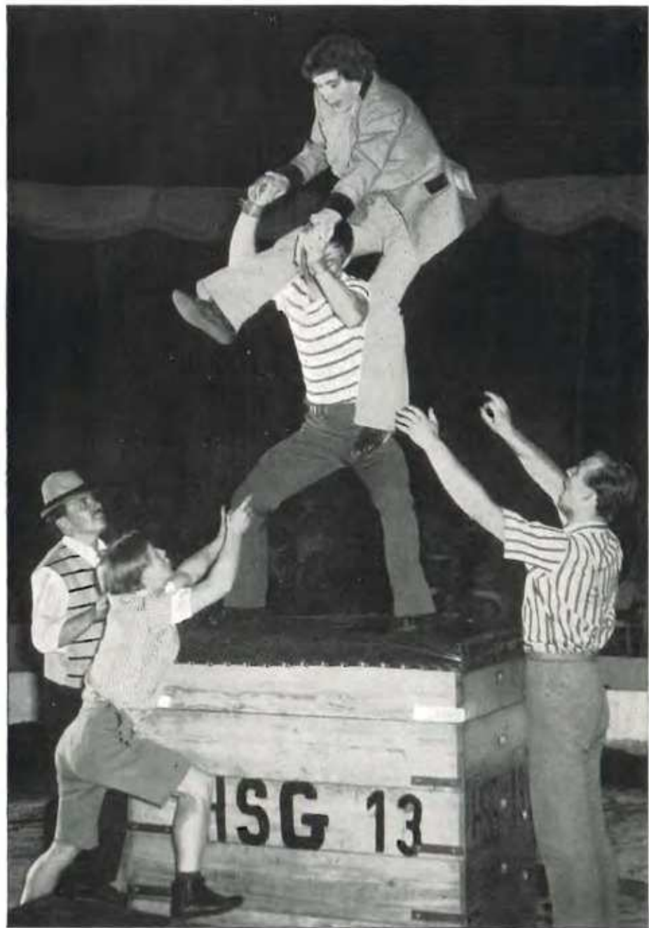
HSG 13 – Eine lustige Haussportgemeinschaft stellt sich unter diesem Namen vor.