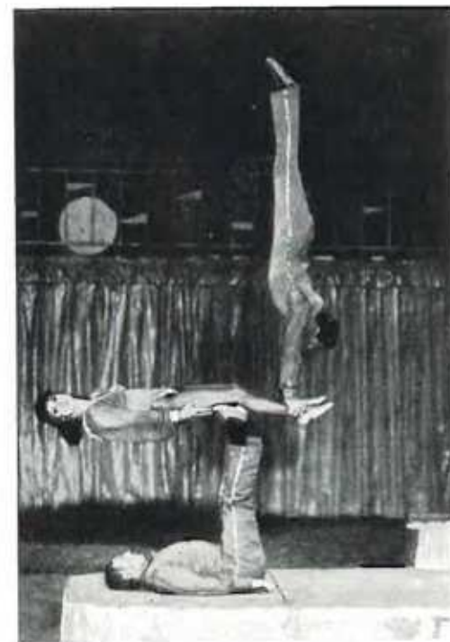
Die Berolinas vereinen moderne Technik mit artistischem Können.