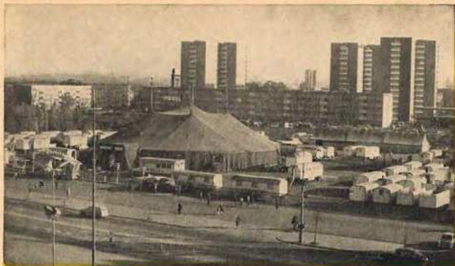
Cirkus BEROLINA v roce 1968 v Ostravě