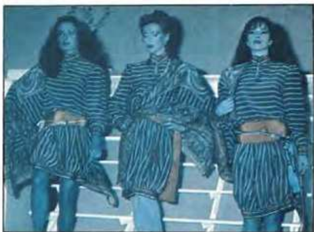
Απο τις εργασίες των πετυχημένων αποφοίτων Μοντελιστ και Μαννεκέν