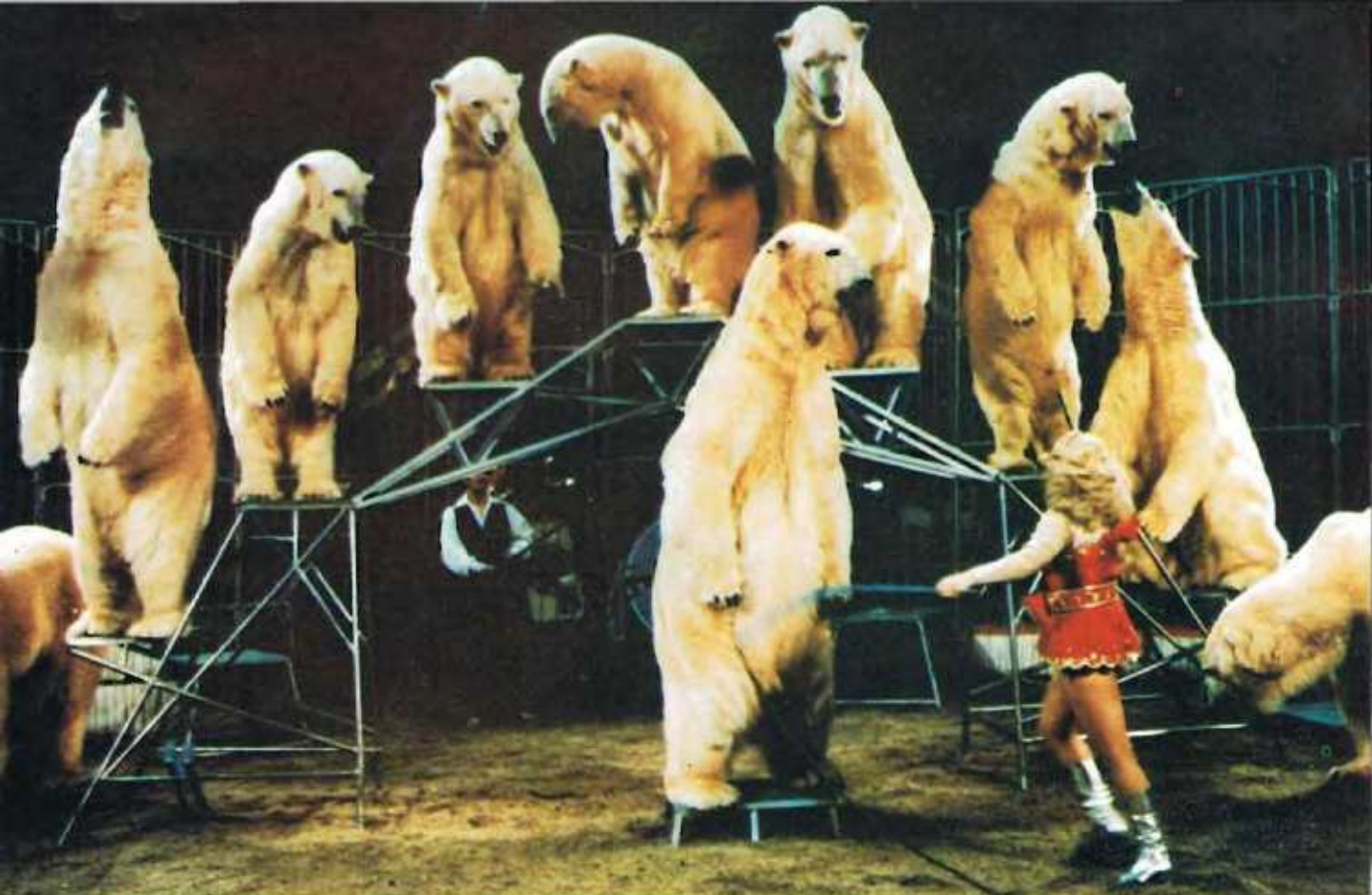
ΟΙ ΠΟΛΙΚΕΣ ΑΡΚΟΥΔΕΣ