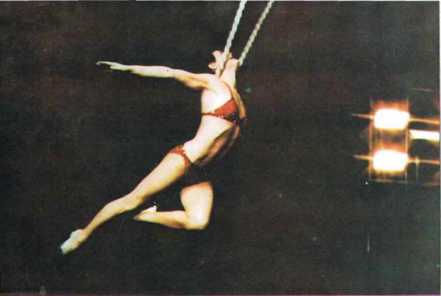
ΑΚΡΟΒΑΣΙΕΣ ΠΑΝΩ ΣΕ ΣΚΟΙΝΙ