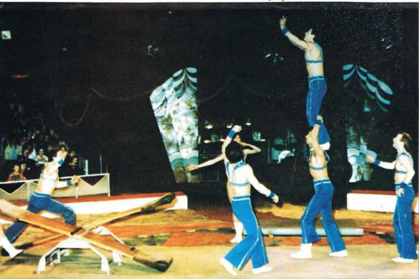
ΑΚΡΟΒΑΣΙΕΣ ΓΙΑΝΩ ΣΕ ΤΡΑΜΠΑΛΑΪ ΟΙ RIALTOS