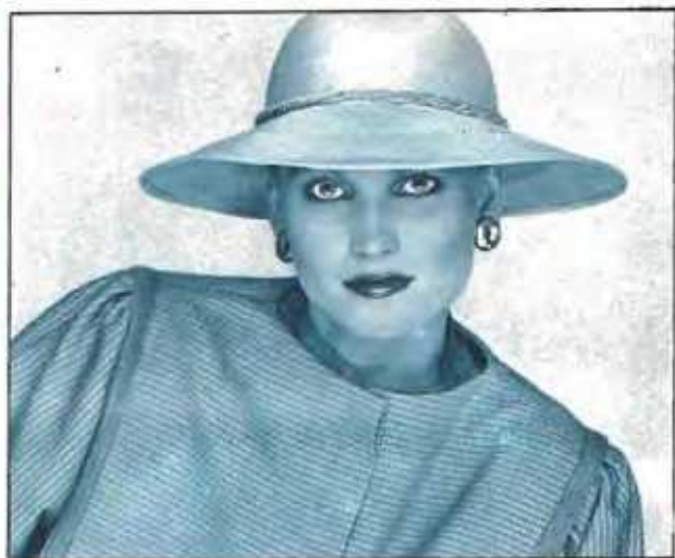
Η ομορφιά διδασκεται στην ΠΑΝ-ΣΙΚ