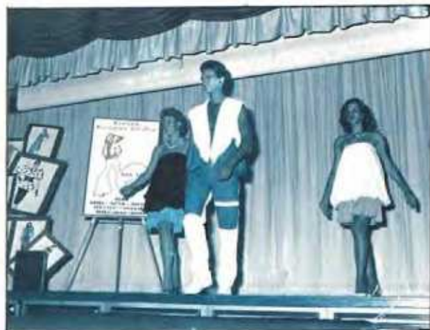
Ιούνιος 83 με δημιουργίες των αποφοίτων της χρονιάς