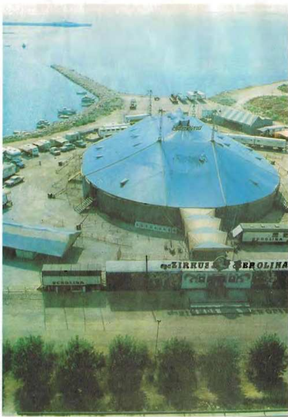
Cirkus Berolina během zvláštního pohostinského vystoupení v Řecku v roce 1983