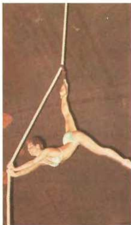
Působ a umění ve výšce: 2 Majaro na vertikální lano