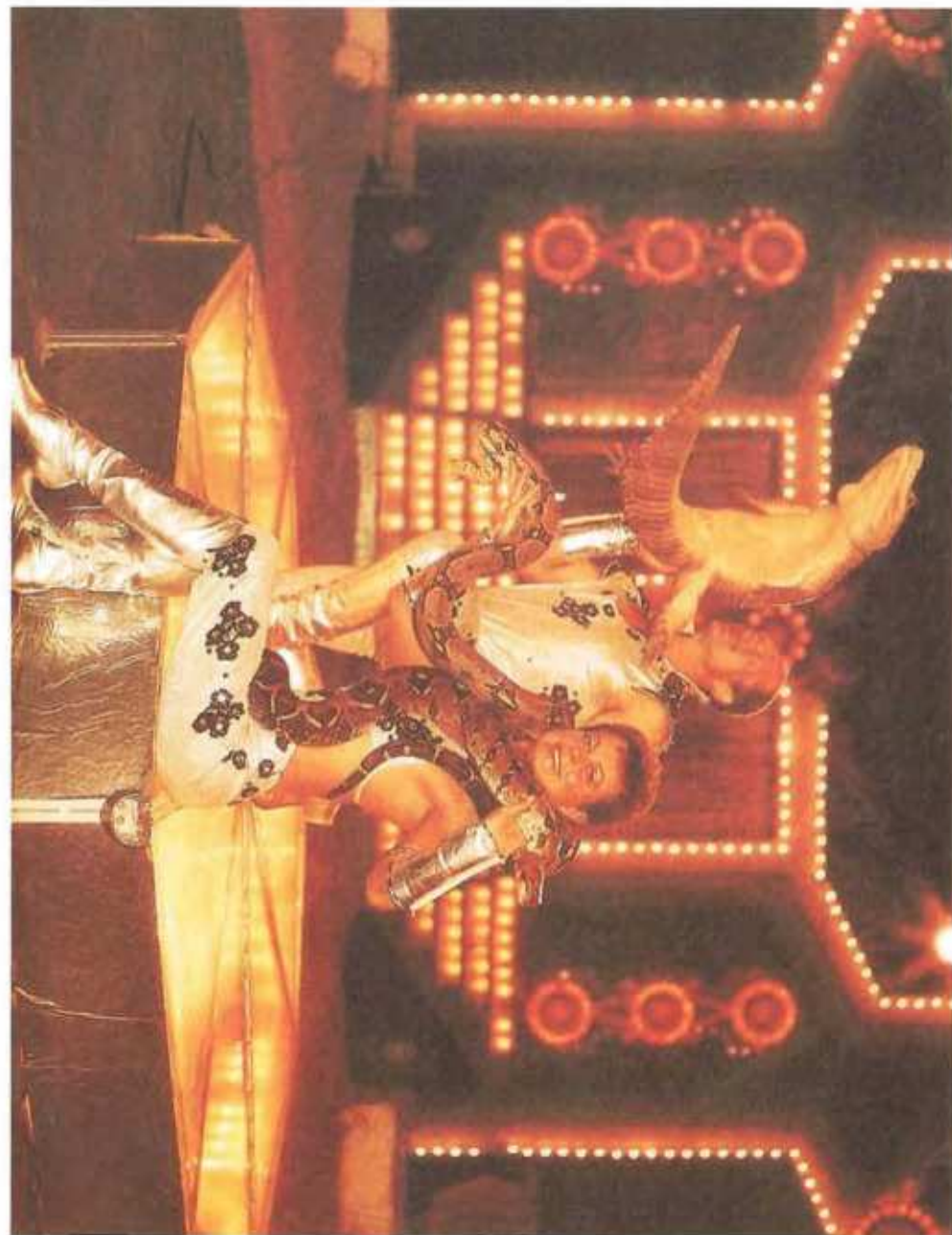
Dresůra s hady a krokodýly: Duo Bokai