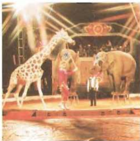
Lady Ros: Kombinovaná dresura slonů a žirafy

V našem programu „Cirkusová Parada“ se vám představí: